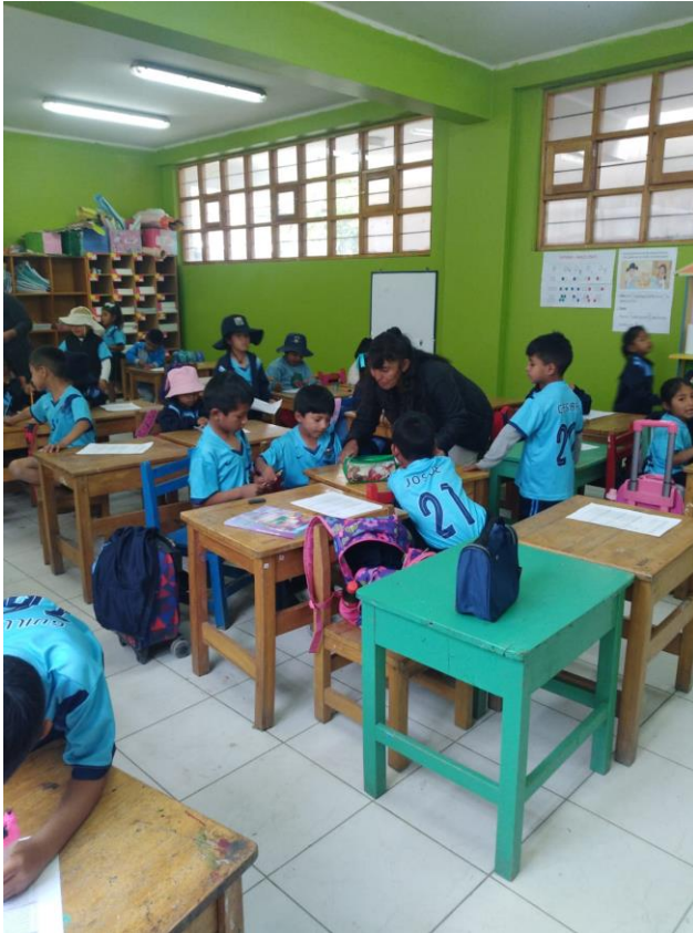
NIÑOS RESOLVIENDO LA ENCUESTSA