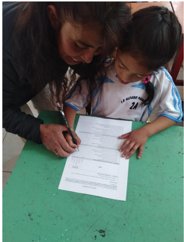
AYUDANDO A RESPONDER EL CUESTIONARIO