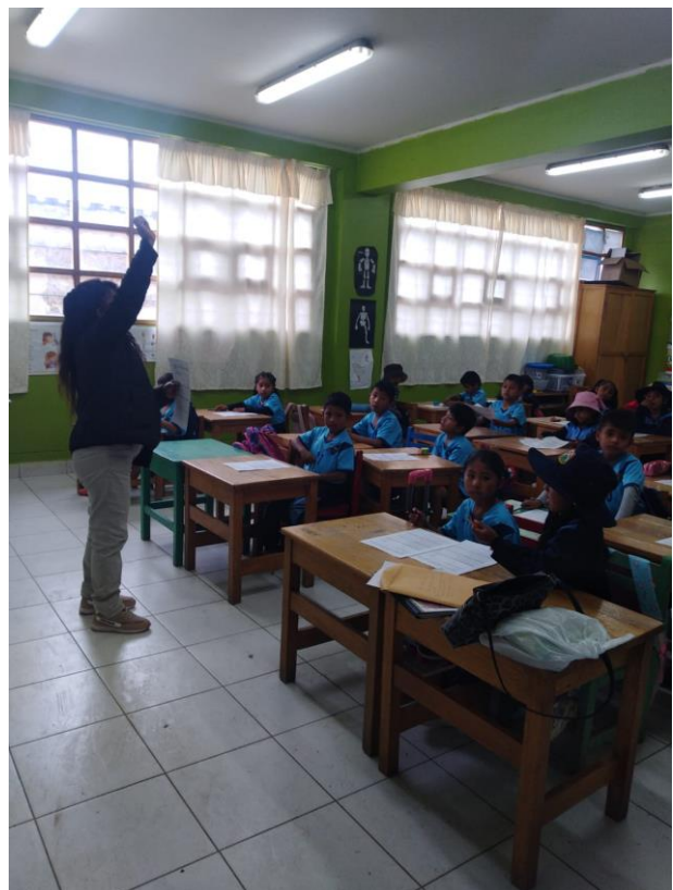
UNA, DOS Y TRES... A CANTAR OTRA VEZ