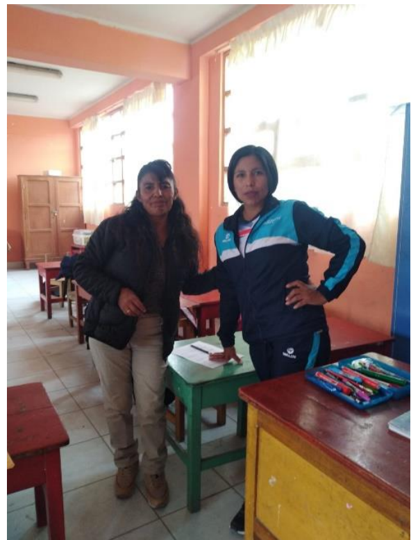
UN INSTANTE CON LA PROFESORA DE AULA