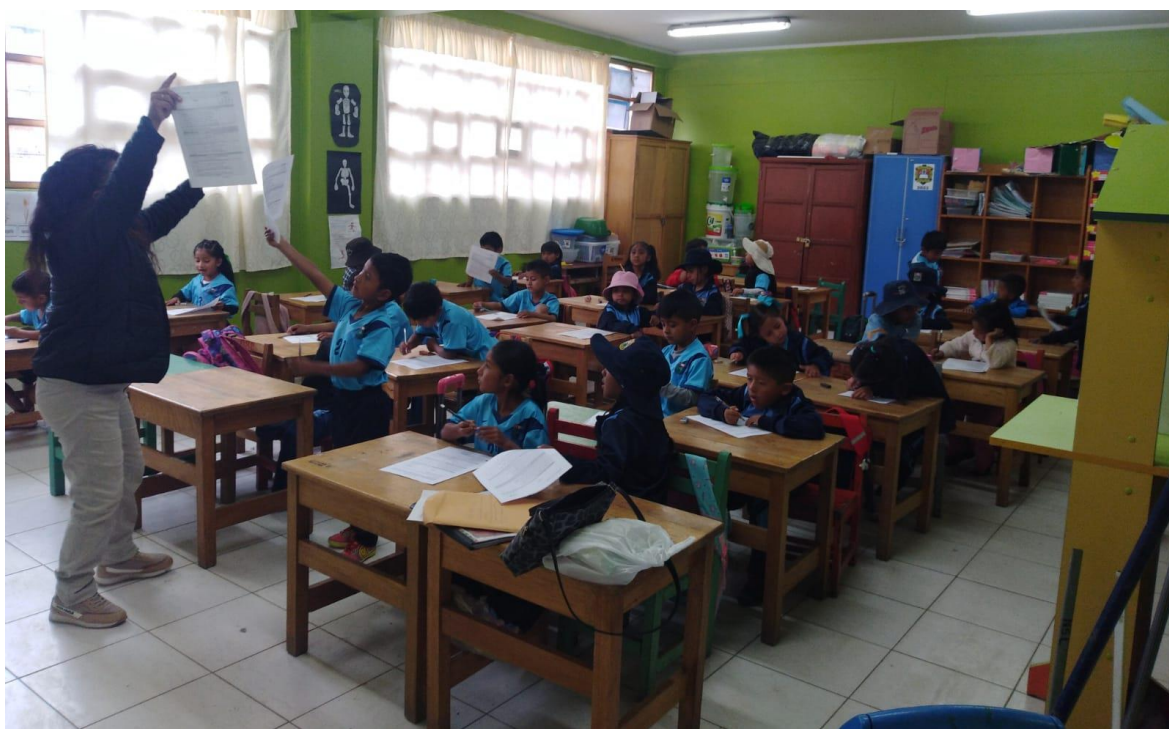
... UNO , DOS Y AL GOLPE!