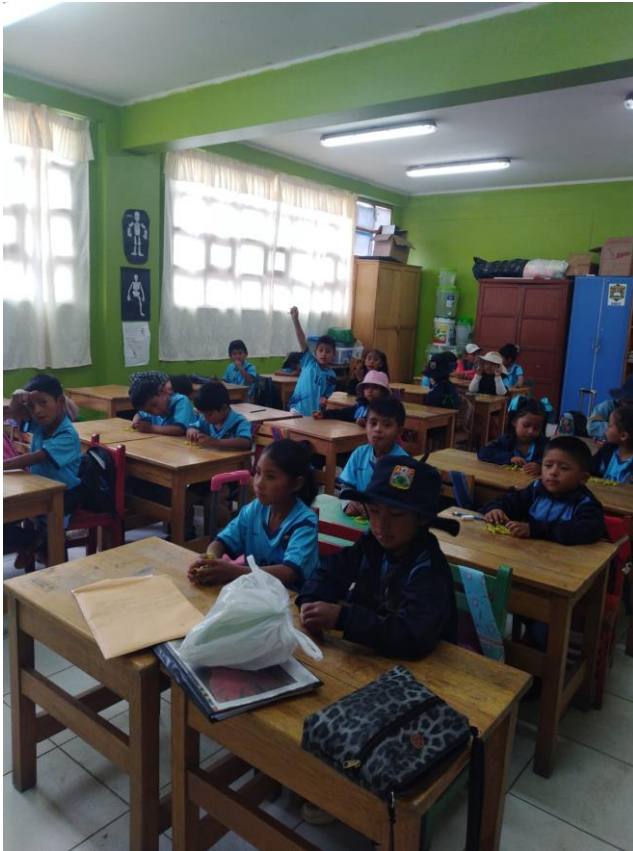
RECORDANDO NUESTROS APRENDIZAJES