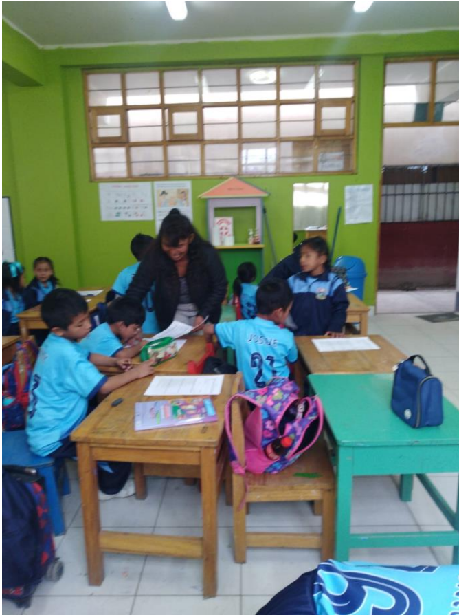
OTRO GRUPO RESOLVIENDO LA ENCUESTA